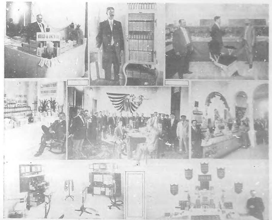
Primer Congreso Odontológico Nacional.—Vistas de varios aspectos de la exposición de manufacturas dentales.