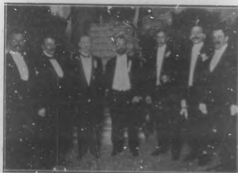
Primer Congreso Odontológico Nacional.—Comisión de redacción de la Sesión Inaugural celebrada en el Ateneo.