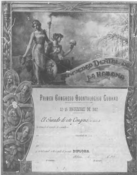
Fotocopia del Diploma del primer Congreso Odontológico Nacional.

Lo que se ha obtenido, vosotros lo sabéis por la prensa diaria, que se ha hecho eco de nuestros triunfos. El Honorable Ayuntamiento de nosotros, el 30 de Septiembre último,