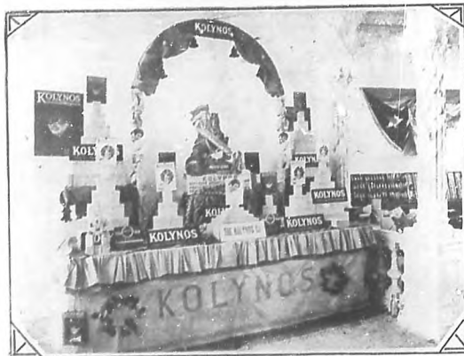
Primer Congreso Odontológico Nacional. Exhibición del producto Koly nos preparado para la higiene de la boca que obtuvo diploma honorífico.

mente aséptico y que nos demostraba claramente los grandes progresos que ha obtenido la cirugía dental en todas sus esferas.