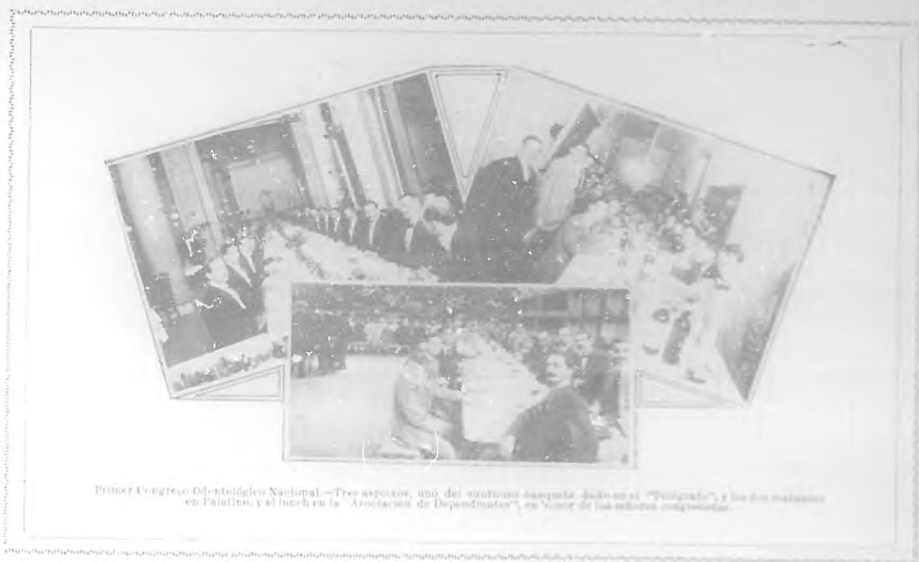
Primer Congreso Odontológico Nacional.—Tres aspectos, que del mismo aspecto toman el "Fotógrafo", y los dos señores en primer plano, y el hotel en la "Asociación de Dependientes", en honor de los señores organizadores.

esta, de hombres de ciencia y de personas cultas. En la realización de este proyecto, que dentro de dos días será realidad, nos han auxiliado poderosamente el Jefe Secretario de Instrucción Pública y Bellas Artes y otros altos funcionarios de ese Departamento, á los que en este acto, nos complacemos en demostrarle públicamente nuestra gratitud.