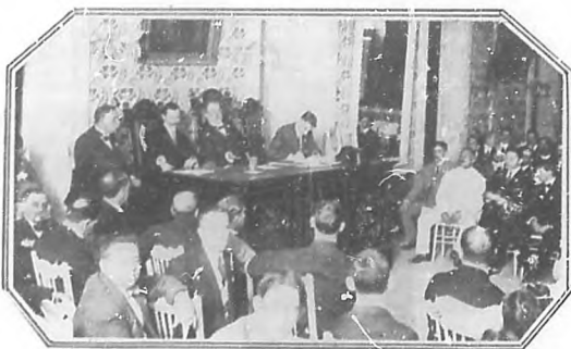
Primer Congreso Odontológico Nacional.—Sesión científica celebrada en el Ateneo.