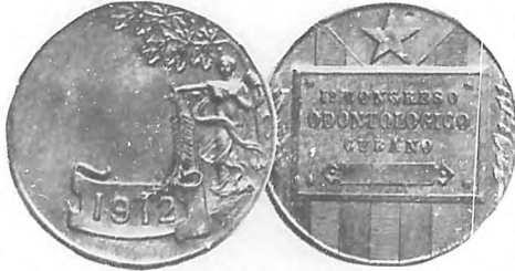
Premio a la Compañía Dental.—Medalla de Bronce.

Todos los muebles expuestos, escupidores de fuentes, y demás aparatos, todos de porcelana y esmalte blanco dan a la exhibición un aspecto completa-