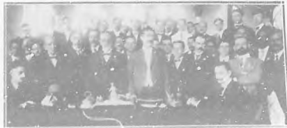
Primer Congreso Odontológico Nacional.—Mesa de la Presidencia y el Consejo de Higiene Dental Infantil, celebrado en la Asociación de Dentistas.