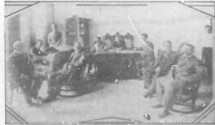
Primer Congreso Odontológico Nacional.—Vista de la Secretaría General.