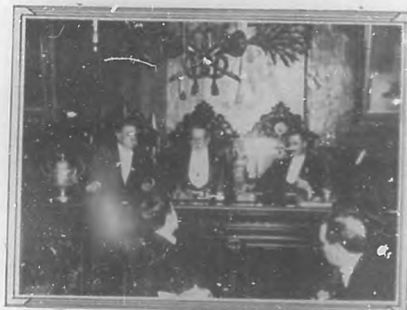
Primer Congreso Odontológico Nacional.—Sesión científica en el Ayuntamiento.