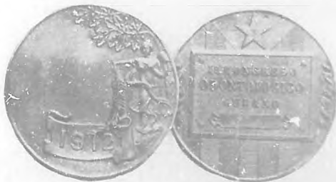
Medalla conmemorativa del primer Congreso Odontológico Nacional.

Hemos contado siempre, desde que en nuestras gestiones comenzamos, no sólo con el apoyo de los dentistas, que al cabo, es [un apoyo interesado, por cuanto son ellos los que han de recoger los más sazonados frutos de esta justa