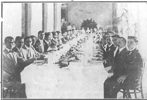
Aspecto del banquete dado en Remedios con motivo de la inauguración del Casino Español de aquella localidad.